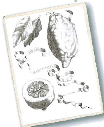
Limon Amalphitanus , aus Ferrari, 1646