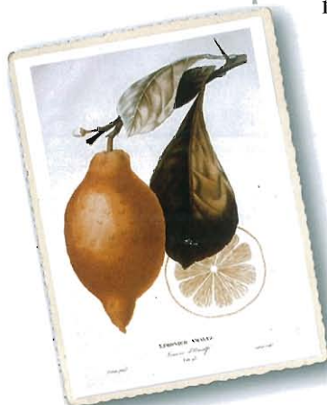
Limonier Amalfi ( Limone d'Amalfi ), aus Risso e Poiteau, 1818

Eine alte Varietät, schon seit Jahrhunderten kultiviert, die ihren Namen der langgestreckten Form und der Verbreitung an der Amalfi-Küste verdankt.