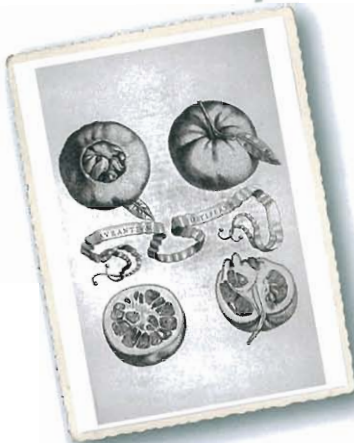
Aurantium foetiferum , aus Ferrari, 1646

Diese Sorte war im 17. Jh. in Italien und Europa bekannt und verbreitet.