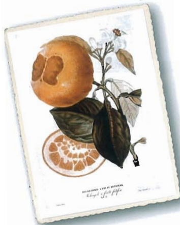
Bigaradier a fruit fetifera ( Melangolo a frutto fetifero ), aus Risso e Poiteau, 1818