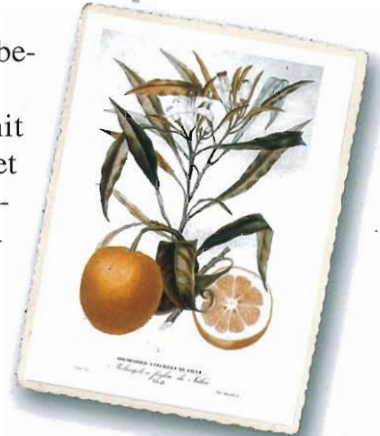
Bigaradier a feuilles de saule ( Melangolo a foglia di Salcio ) aus Risso e Poiteau, 1818

Sie läßt sich auch durch Samen vermehren.