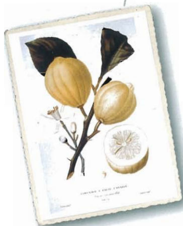
Limonier a fruit cannelé ( Limone incannellato ), aus Risso e Poiteau, 1818