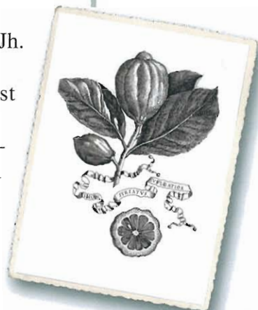
Limon striatus vulgator , aus Ferrari, 1646