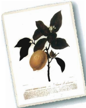
Citrus Medica Limon (Limone di giardino), aus Targioni Tozzetti, 1825

NORMALE ODER GARTENZITRONE, AUCH FLORENTINISCHE GENANNT