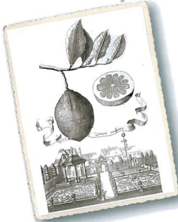
Limon vulgare , aus Volkamer, I, 1708