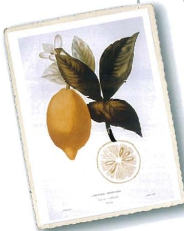
Limon ordinaire ( Limone ordinario ), aus Risso e Poiteau, 1818