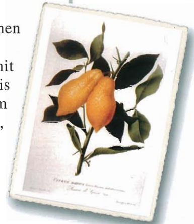
Citrus Medica Limon Ponzinus chalcedonicus, oblong ( Limone di Gaza lungo ), aus Targioni Tozzetti, 1825

Kräftiger, nach oben strebender Wuchs, mit unregelmäßiger Krone. Blätter mittelgroß bis groß, oval-elliptisch. Blüht bevorzugt im Frühjahr und Herbst. Violette Blütenknospen, die meist einzeln erscheinen. Langgestreckte oder birnenförmige Frucht, größer als eine Zitrone, mit deutlichem Hals und hervorstehendem Spitzenhöcker. Die Schale ist dick, rau, von blaßgelber Farbe. Im Winter tendiert der Baum zum Laubabwerfen, aber in Hinsicht auf seine Ziereigenschaften bleibt es ein interessantes Gewächs.