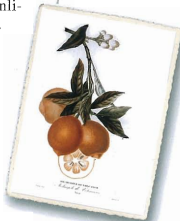
Bigradier de Volcamer (Melangolo di Volcamerio) , aus Risso e Poiteau, 1818